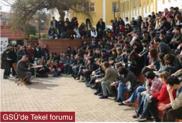
GSÜ'de Tekel forumu

Tekel işçilerinin direnişi, hak arama mücadelesinde adeta bir destan yazdı. Eylem Danıştay'ın kararının sonucunu beklemek için 28 Şubat'ta çadırların sökülmesiyle sona erdi. Tekel işçileri çadırları sökerken