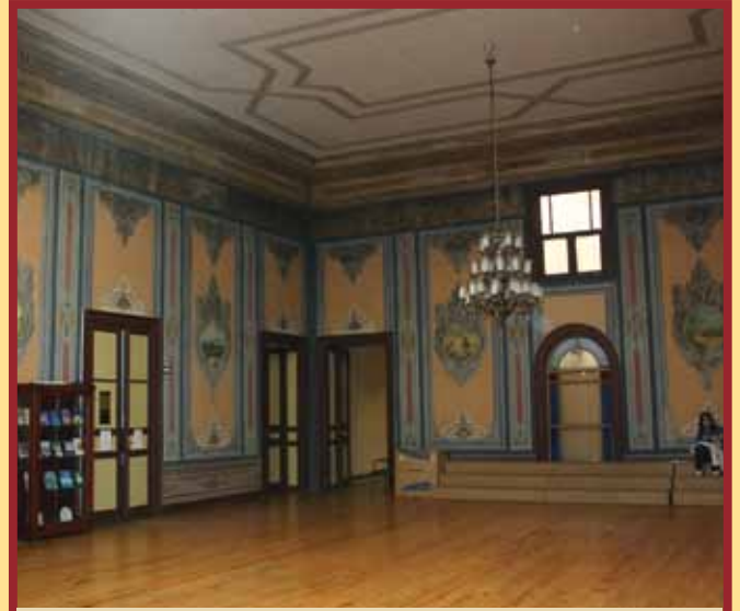
Binalarımızda günümüze kadar gelebilmiş iki çeşit süsleme bulunuyor; tavanlarda ahşap çitallı bezemeler ve duvarlarda kalem işleri.

Yıldız Sarayı'ndan başlayan ve sahile ulaşınca denize paralel giden gizli bir dehliz, Çırağan Sarayı, bugünkü Ziya Kalkavan Denizcilik Meslek Lisesi ve Galatasaray Üniversitesi yemekhanesinden Kabataş Erkek Lisesi'ne doğru ilerliyor. Zamanla içeriden gelen kötü kokular ve dışarıya verdiği rahatsızlık üzerine geçitlerin giriş ve çıkışları kapatılıyor.