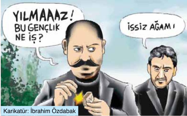
Karikatür: İbrahim Özdemir

Birçok insan bunu düşünüyor. Çünkü akademisyenlik özel sektöre göre çok daha iyi çalışma şartları sunan, güvencesi olan bir iş. Ben şimdilik düşünmüyorum.