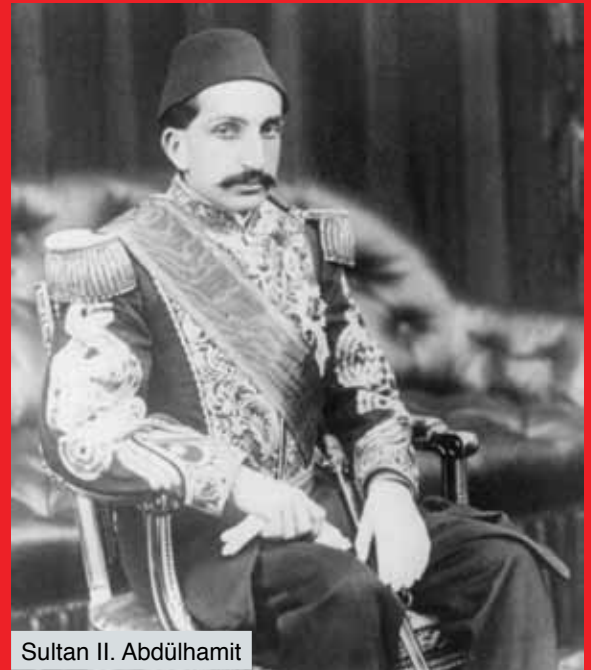
Sultan II. Abdülhamit

2010 yılı, bu acı olayın da yaşandığı dostluğun 120. yıldönümü oluyor. Bu yıl Türkiye’de “Japonya Yılı”, Japonya’da “Türkiye Yılı” ilan edildi.