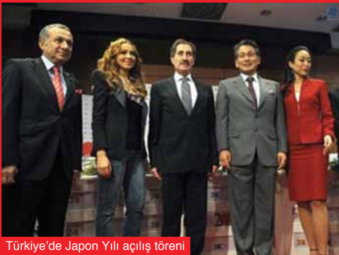
Türkiye'de Japon Yılı açılış töreni

Benim için çok keyifliydi, bana okul yıllarımı hatırlattı. Japonya'da oyunculuk eğitimi aldım, tekrar Japon oyuncularla sahneye çıkmak öğrencilik yıllarımı anımsattı. Sahne arkasında Türk kahvesi veya demleme çay değil; yeşil çay içiliyor. Bunların hepsi benim için çok keyifli birer hatıraydı ve şimdi aynı hissi tekrar yaşıyorum.