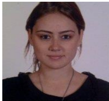
Beste Cumalı Dış Ticaret ve İhracat Sorumlusu-Oyak-Renault